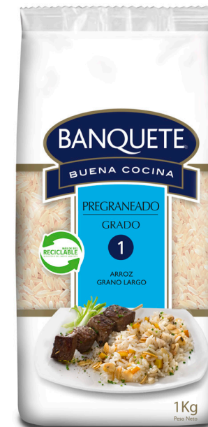
Arroz Pregraneado Formato: 1 kg

Haz de cualquier ocasión, todo un banquete con estas sabrosas variedades de arroz. Buena fuente de energía, nutritivos, equilibrados y por supuesto, ¡exquisitos!