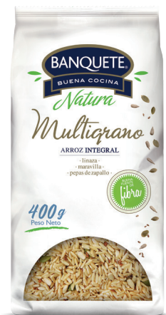
Multigrano con Arroz Integral, Linaza, Maravilla y Pepas de Zapallo Formato: 400 g