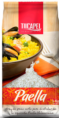
Arroz para Paella G1 Formato: 1 kg