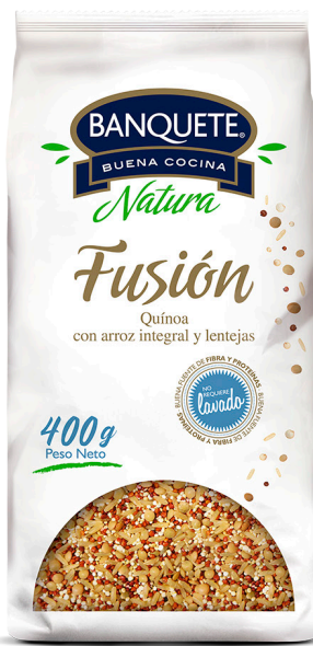
Fusión Quínoa, Arroz Integral y Lentejas Formato: 400 g