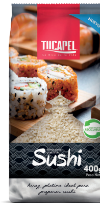
Arroz para Sushi Formato: 400 g