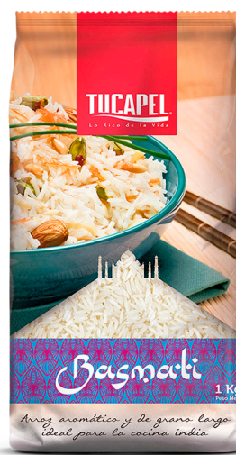
Arroz Basmati G1 Formato: 400 g y 1 kg