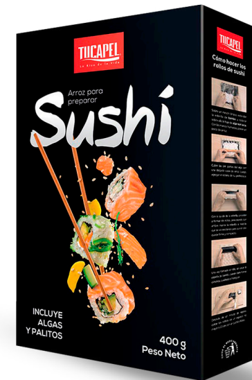
Arroz Kit para Sushi Formato: 400 g

Lúcete con tus mejores recetas internacionales usando nuestra variedad de arroces culinarios para hacer de tu comida todo un viaje de sabores.