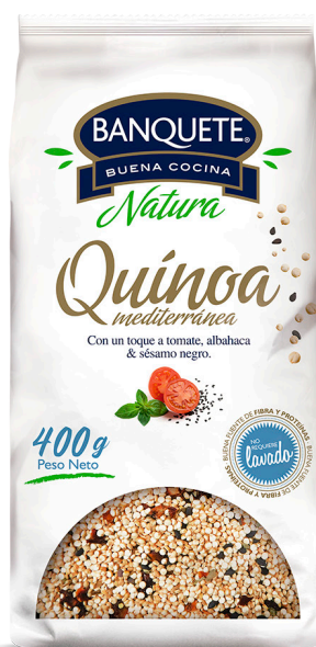
Quínoa Mediterránea Formato: 400 g