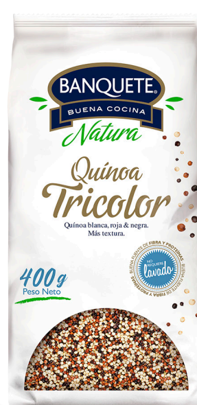
Quínoa Tricolor Formato: 400 g y 250 g