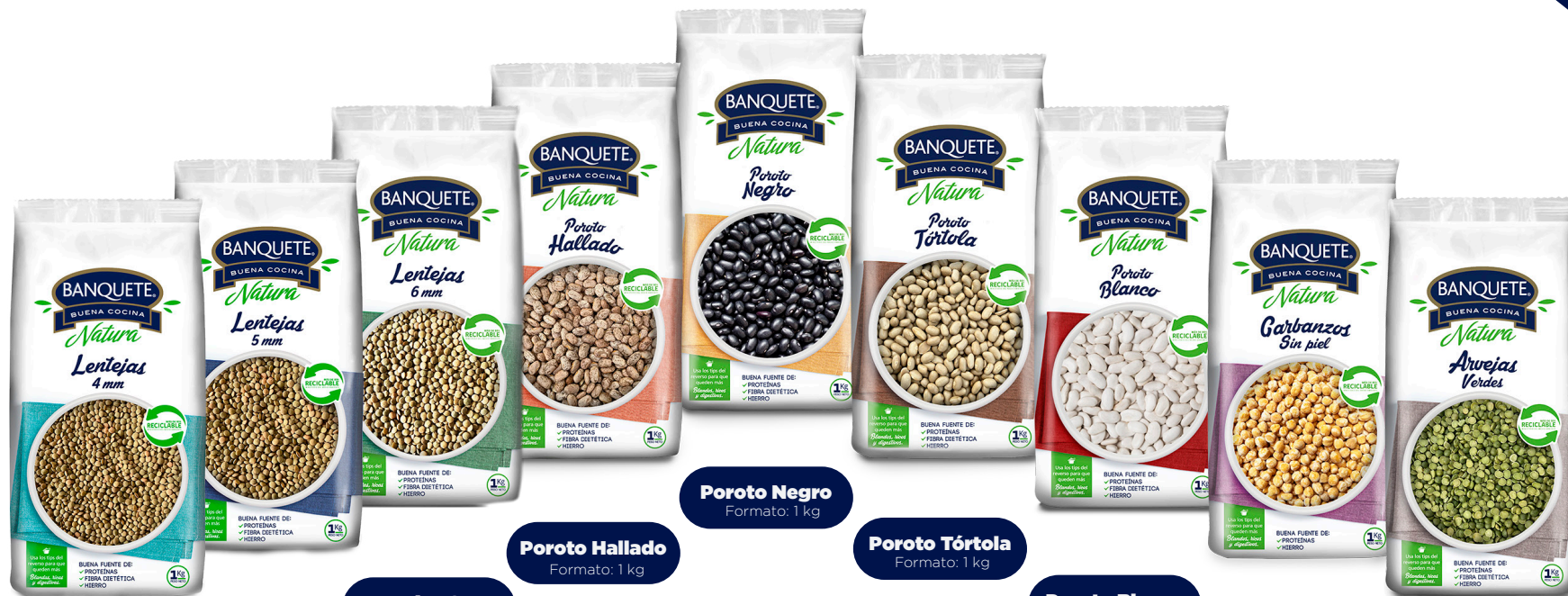
Lentejas 4mm Formato: 1 kg