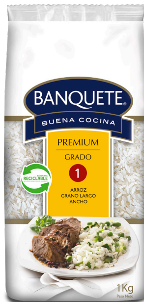
Arroz Premium Grano Largo Ancho G1 Formato: 1 kg y 2 kg