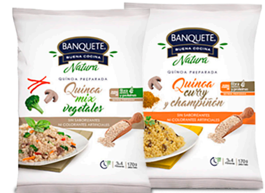
Quínoa Preparado Curry Champiñón Formato: 170 g