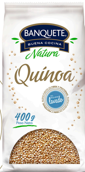
Quínoa Formato: 400 g y 250 g

¡La mejor opción para comer rico y saludable! Conoce la variedad de productos que Banquete te ofrece para disfrutar la exquisita quínoa en diferentes versiones.