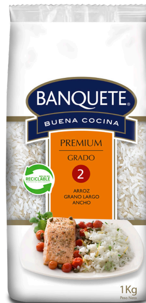
Arroz Premium Grano Largo Ancho G2 Formato: 1 kg